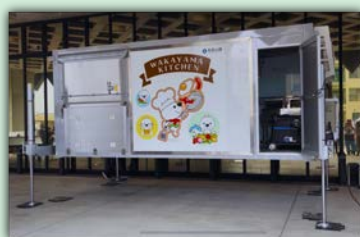
キッチンコンテナ