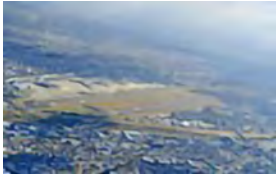
大阪国際空港設計(伊丹空港) (第三港湾建設局大阪空港工事事務所)