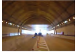
箕面トンネルプロジェクト (大阪府道路公社)