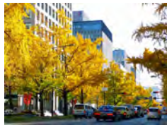
御堂筋空間再編調査 (大阪市)